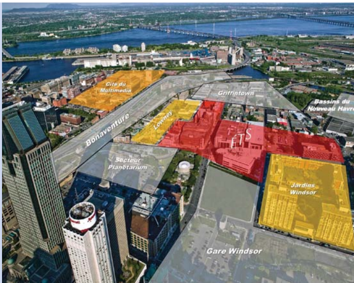
LE QUARTIER DE L'INNOVATION, PROJET DE L'ÉCOLE DE TECHNOLOGIE SUPÉRIEURE.