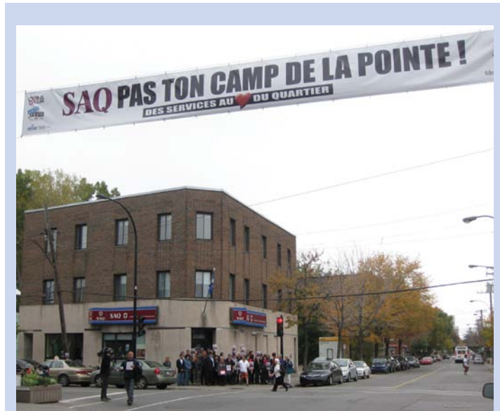
MOBILISATION CITOYENNE CONTRE LA FERMETURE DE DEUX SUCCURSALES DE LA SAQ.

D'autres actions sont prévues dans les prochains mois pour s'assurer de conserver les deux succursales. Pour information : resomtl.com et actiongardien.org . ///