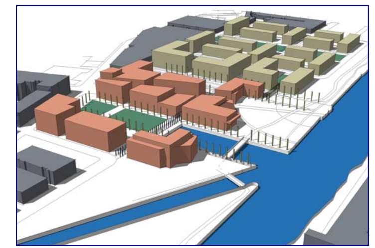
Vues en trois dimensions du plan d'aménagement

Le Plan d'aménagement proposé par la Coalition de la Petite-Bourgogne, Bâtir son quartier et le RESO : la partie récréotouristique est située à l'ouest (à gauche); au centre, les activités commerciales et de bureau alors que l'habitation serait située à l'est (à droite).