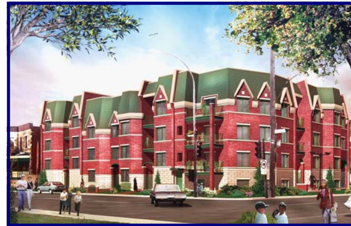
Weber Laurent, architecte

Cette maquette de la coopérative Les terrasses Wellington / Charlevoix, un projet de Bâtir son quartier, est un bon exemple du type d'habitation coopérative qui pourrait être réalisée sur le site de Postes Canada.