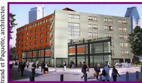
Bertrand et Paquette, architectes

D'une superficie d'un million de pieds carrés, ce site est situé dans la Petite-Bourgogne, entre la rue Ottawa et le canal de Lachine et entre les rues du Séminaire et Richmond. Situé à proximité du centre-ville, du Vieux-Montréal, de la cité du multimédia et du marché Atwater, sa localisation est stratégique.